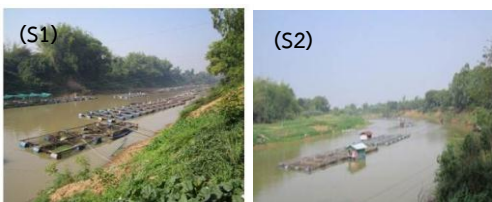
Fig. 2 Physical characteristic of sampling site at Ban-Kok (S1) and Ban-Laengtai (S2)

พื้นที่โดยรอบของแม่น้ำชีมีลักษณะที่เป็นพื้นที่ชุ่มน้ำ เป็นพื้นที่ราบลุ่มริมฝั่งน้ำท่วมถึงพื้นที่ที่จะถูกน้ำท่วมทุกปี ตลอดระยะฤดูฝนของช่วงน้ำหลากและน้ำจะลดลงมาก ในช่วงฤดูแล้ง ลักษณะทางกายภาพโดยทั่วไป ของสถานที่ ที่ทำการเก็บตัวอย่างทั้ง 6 สถานีนั้น จะพบลักษณะทาง กายภาพของแม่น้ำชีมีลักษณะคล้ายคลึงกันแต่กิจกรรมของ ประชาชนที่อาศัยอยู่โดยรอบแต่ละสถานีจะแตกต่างกันซึ่ง อาจส่งผลต่อคุณภาพน้ำในแม่น้ำชีของแต่ละสถานี สภาพ ทั่วไปดังนี้ สถานีที่ 1 (S1) บ้านกอกและสถานีที่ 2 (S2) บ้าน เลิงใต้ อำเภอโกสุมพิสัย เป็นช่วงแรกของแม่น้ำชีที่ไหลผ่าน เข้าสู่จังหวัดมหาสารคาม ทั้งสองสถานีจะมีการเพาะเลี้ยง ปลาในกระชังเป็นจำนวนมาก น้ำจะมีสีเขียวขุ่นมีกลิ่นคาว ปลา ดัง Fig. 2 ส่วนสถานีที่ 3 (S3) นั้นเป็นช่วงที่แม่น้ำชี ไหลผ่านบ้านท่าขอนยาง อำเภอกันทรวิชัย ซึ่งเป็นชุมชน ขนาดใหญ่ เป็นที่ตั้งของมหาวิทยาลัยมหาสารคาม มีหอพัก อพาร์ทเมนต์ คอนโดมิเนียม และร้านอาหารเป็นจำนวนมาก บางแห่งมีท่อปล่อยน้ำเสียจากชุมชนลงสู่แม่น้ำชีโดยตรงโดย ไม่มีการบำบัดน้ำเสีย สถานีที่ 4 (S4) บ้านแก้งอำเภอเมือง มหาสารคาม บริเวณนี้เป็นแหล่งชุมชนประชาชนส่วนใหญ่มี อาชีพทำนา มีการเลี้ยงปลาในกระชังจำนวนน้อย มีการ ประมงพื้นบ้านปลุกผักสวนครัวตามริมฝั่งแม่น้ำชี สถานีที่ 5 (S5) บ้านม่วง อำเภอเมืองมหาสารคาม เป็นแหล่งชุมชน ขนาดเล็กประชาชนใช้น้ำเพื่อการเกษตรกรรม ได้แก่ การทำนา บริเวณริมฝั่งมีการปลุกผักจำนวนมาก และสถานีที่ 6 (S6) บ้านท่าตูม อำเภอเมืองมหาสารคาม เป็นสถานีที่แม่น้ำชีจะ ไหลผ่านเข้าสู่เขตจังหวัดร้อยเอ็ดประชาชนส่วนใหญ่ใช้น้ำ เพื่อการเกษตรกรรม มีการทำประมงพื้นบ้านและไม่มีการ เพาะเลี้ยงปลาในกระชัง