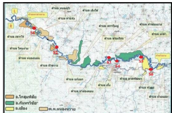
Fig. 1 Mapping of sampling site at the Chi River, Maha Sarakham Province

การวิเคราะห์คุณภาพน้ำ ใช้ค่าทางสถิติ ได้แก่ ค่าเฉลี่ย และค่าส่วนเบี่ยงเบนมาตรฐาน (Tanthawanich, 2000) การวิเคราะห์ความหลากหลายของสัตว์หน้าดิน ได้แก่ ดัชนีความหลากหลาย (Shannon - Weiner Diversity Index) ดัชนีความสม่ำเสมอ (Sheldon, 1969) และดัชนีความชุกชุมทางชนิด (Taxa Richness Index, R) โดยใช้วิธีของ Margalef's Index (Aryuthaka, 2000)